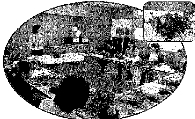
ハロウィン フラワーアレンジメント