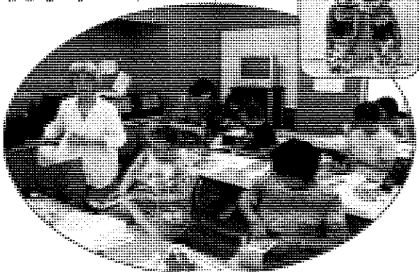
健康布ギョウリづくり